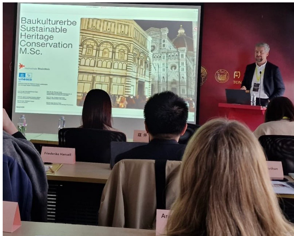
Abb. 06 Sino-German Symposium, 2025