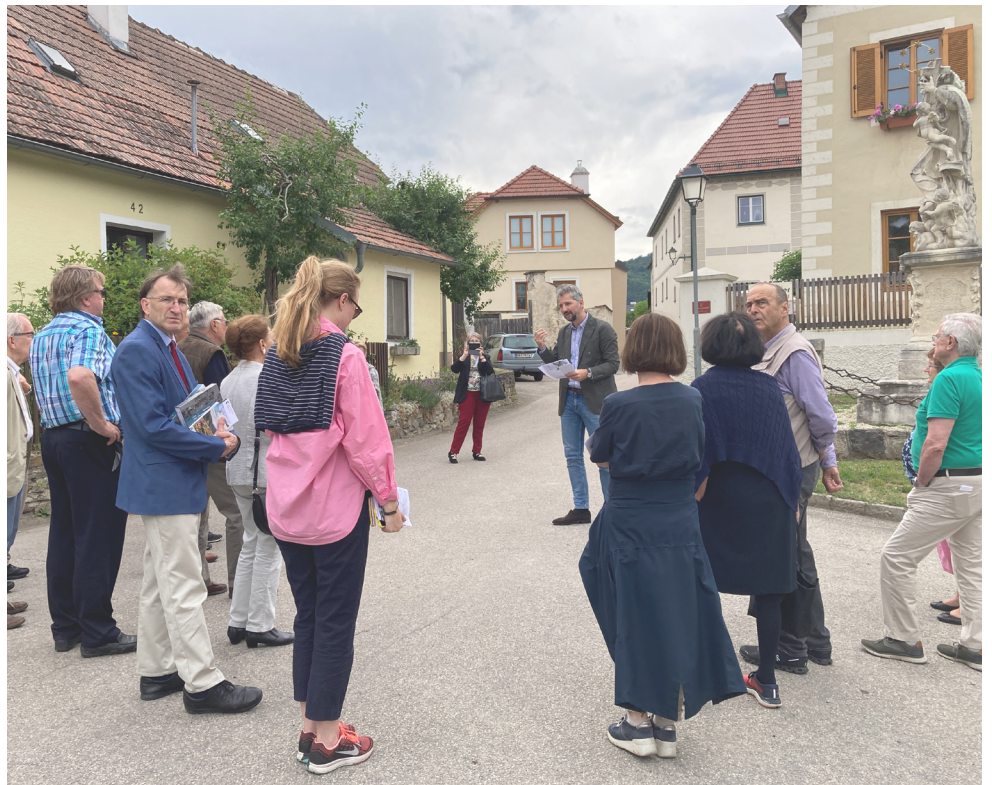
Abb. 07 Leitweg Bauen im Welterbe, 2023 Vermittlung Publikation

2021 Wettbewerb Preisgerichtssitzung Phase 1 Realisierungswettbewerb ,Witterungsschutz Römermauer, Wiesbaden, Jury Mitglied, 2021